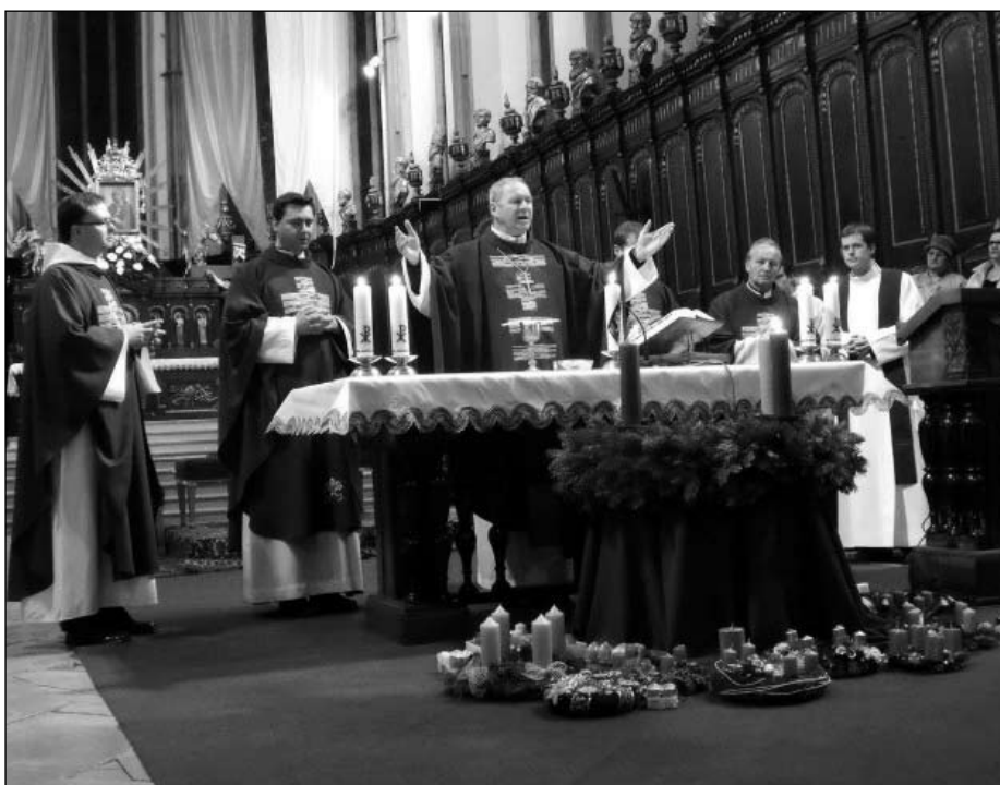
Vigília adventnej nedele v Trnavskej arcidiecéze

Kongregácia pre biskupov zmenila 31. marca 1995 názov Trnavskej arcidiecézy na Bratislavsko-Trnavskú arcidiecézu a Dómu sv. Martina v Bratislave udelila titul konkatedrály. Okrem toho Svätý Otec Ján Pavol II. zriadil novú cirkevnú provinciu so sídlom v Košiciach a pričlenil k nej rožňavskú a spišskú diecézu ako sufragánne diecézy.