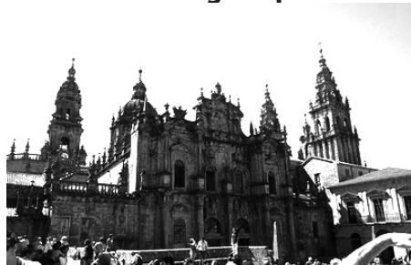
Bazilika v Santiagu de Compostela, Galícii.

Známa hlavne pre kresťanov. Ak sa sem chcete vybrať na výlet, je dobré zohnať si osvedčenie pútnika, ktoré vám vydá arcibiskup. Toto osvedčenie si dávate opečiatkovať na miestach kadiaľ prechádzate. Legenda hovorí, že Jakub starší, najobľúbenejší Ježišov učeník, sa rozhodol priniesť hlas kresťanstva až na koniec sveta. Kraj sveta bol v staroveku na konci známeho sveta, tento koniec bol na území dnešnej Galície v Španielsku. Jakuba po návrate stali, apoštoli jeho telo ukradli a pochovali na mieste, kde dnes