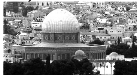
Skalný dóm, islamská svätyňa v centre Chrámovej hory v Jeruzaleme.

Vybudovali ho Moslimovia v srdci bývalého Jeruzalema na najvyššom mieste jeruzalemského Starého mesta. S výstavbou začali v roku 687 pod skalou odkiaľ vraj Mohamed vystúpil do neba. Prví kresťania zase verili, že skala bola miestom, kde Pontský Pilát odsúdil Ježiša na smrť na kríži. Význam má aj pre židovskú kultúru pretože tu údajne Boh začal so stvorením sveta.