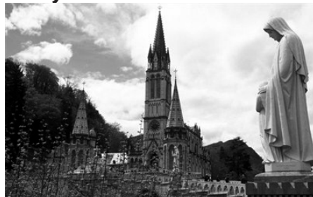
Lurdy je mesto na juhu Francúzska, v podhorí Pyrenej v departemente Hautes-Pyrénées.