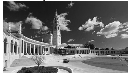
Kaplnka Cova da Iria fo Fatime, najznámejšom pútnikom mieste, ktoré leží v Portugalsku.

Fatimské proroctvo zvestované samotnou Máriou z 13. júla 1917 patrí medzi najznámejšie avšak posolstiev bolo viac. Na jar roku 1916, keď Lucia Santos a jej bratanec Francisko so sestrou Jacintou Marto pásli ovce, uvideli anjela. 13. mája 1917, keď mala Lucia 10, Francisko 9 a Jacinta 7 rokov, a následne 13. dňa každého mesiaca do októbra 1917 sa im zjavovala samotná Mária.