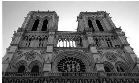
Katedrála Notre-Dame v Paríži, vo Francúzsku.

Na tomto pahorku stojí svetoznáma katedrála Notre – Dame. Od Paríža je vzdialená asi hodinu cesty vlakom. Kvôli svojim vibráciám a silám sa považuje za kultové miesto. Návštevníci si všimli zmenené vnímanie svojho tela. Neskôr vedci priniesli teóriu, že na organizmus vplyva elektromagnetické pole katedrály tým, že mení jeho polaritu. Človek je v súlade so zemskou osou. Sprievodný jav tohto efektu je okysličenie krvi, zmiernenie svalového napätia. Po návšteve katedrály by sme mali byť zbavení negatívnych vibrácií, svieži a uvoľnení.